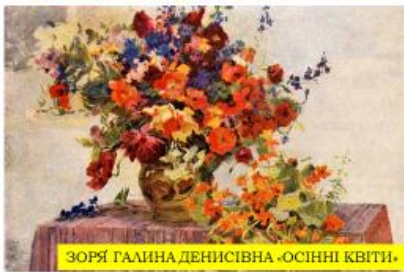
ЗОРЯ ГАЛИНА ДЕНИСІВНА «ОСІННІ КВІТИ»