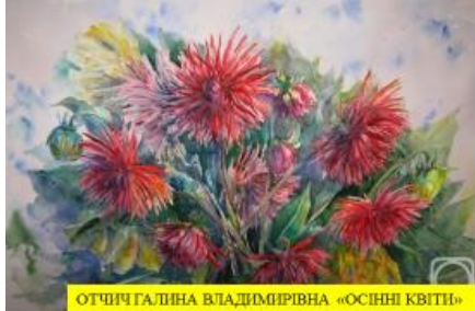
ОТЧИЧ ГАЛИНА ВЛАДИМИРІВНА «ОСІННІ КВІТИ»