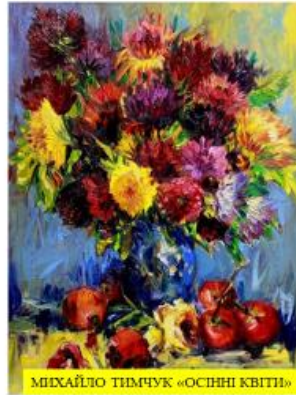
МІХАЙЛО ТИМЧУК «ОСІННІ КВІТИ»